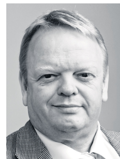
Grétar Mar Jónsson

Höfundur er þingmaður Frjálslynda flokksins í Suðurkjördæmi.