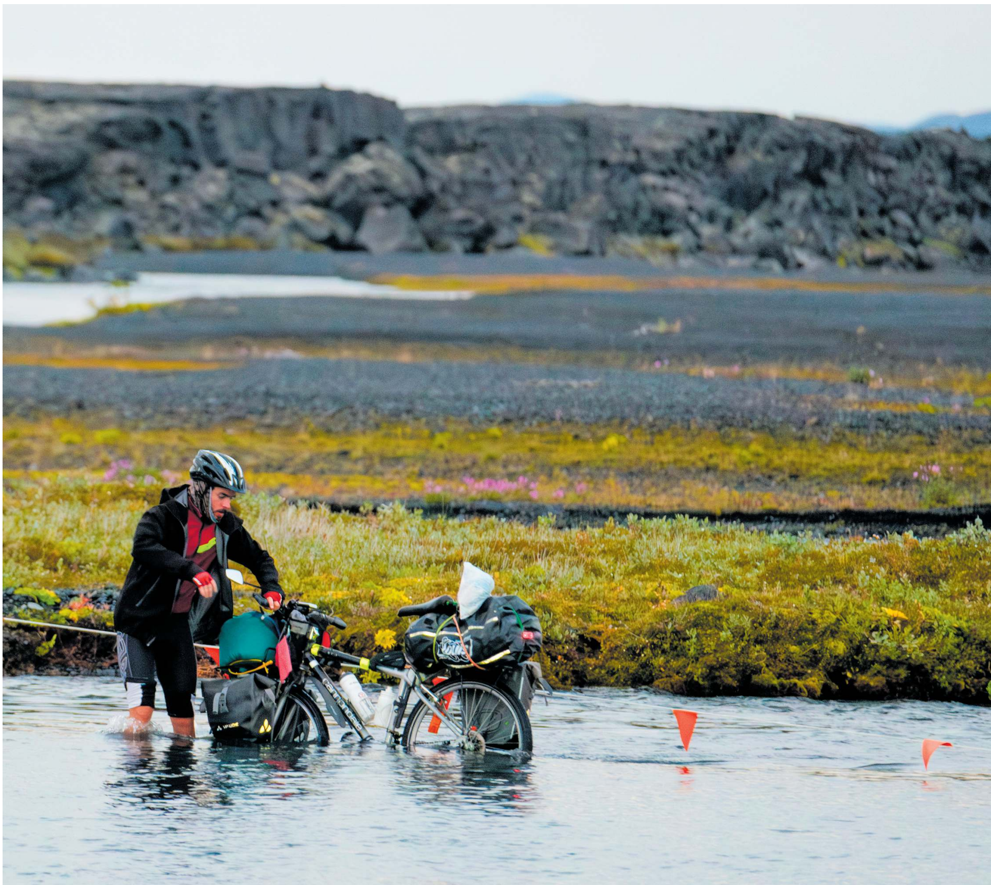
Á flakki Þessi erlendi ferðamaður lét engan bilbug á sér finna þegar hann reiddi reiðhjól sitt yfir Lindá við Herðubreiðarlindir skömmu fyrir sólsetur á miðvikudagskvöld.